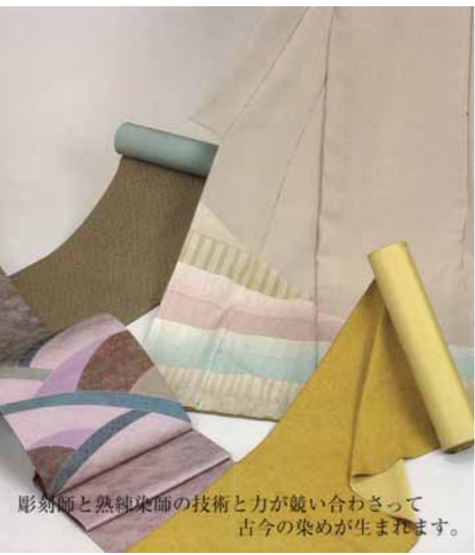
彫刻師と熟練染師の技術と力が競い合わさって古今の染めが生まれます。